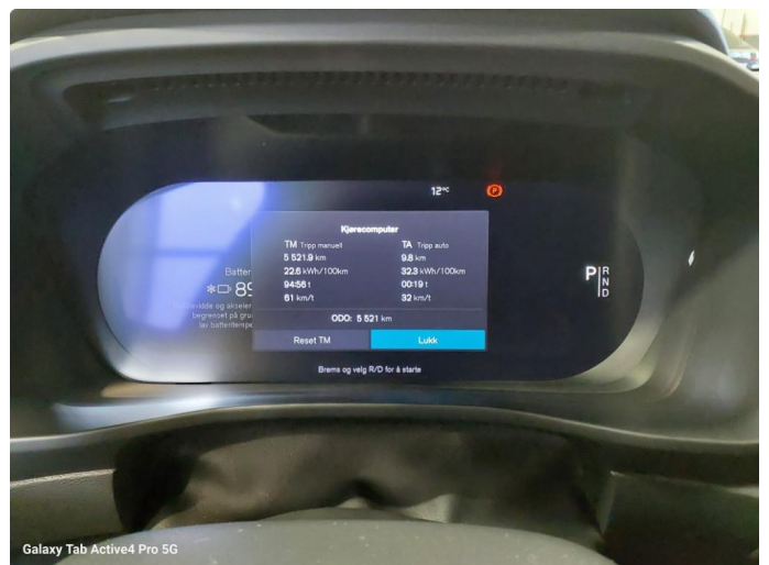
Galaxy Tab Active4 Pro 5G