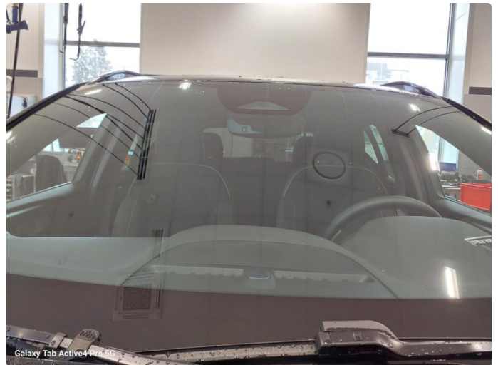
Galaxy Tab Active4 Pro 5G