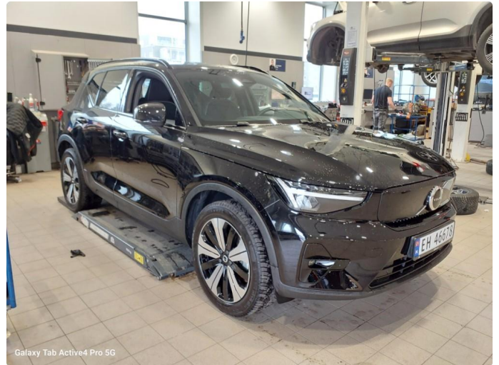
Galaxy Tab Active4 Pro 5G