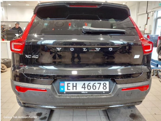
Galaxy Tab Active4 Pro 5G