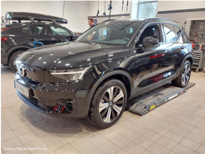
Galaxy Tab Active4 Pro 5G