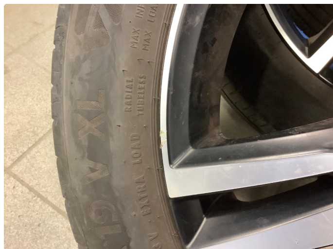
1.2 Noe merker