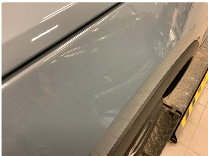
1.1 Liten ripe