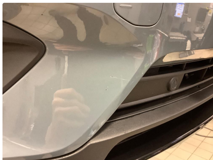
1.3 Lite merke