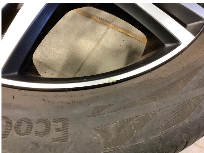
1.2 Noe merker