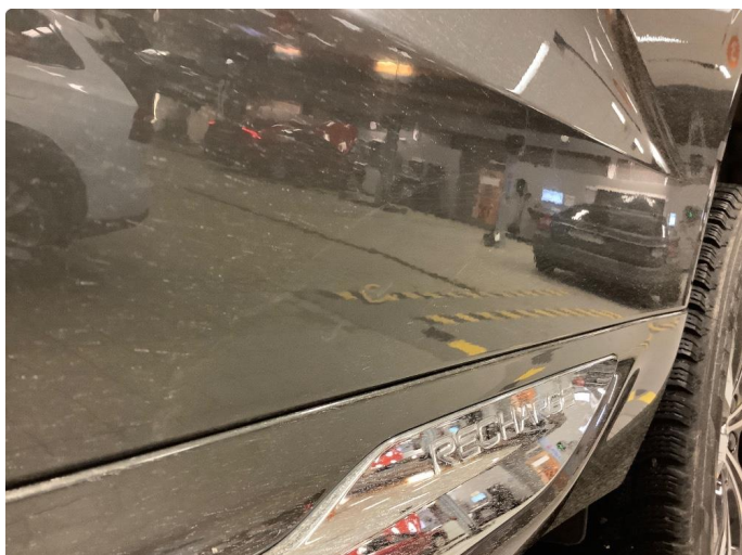
1.1 Veldig liten parkbulk