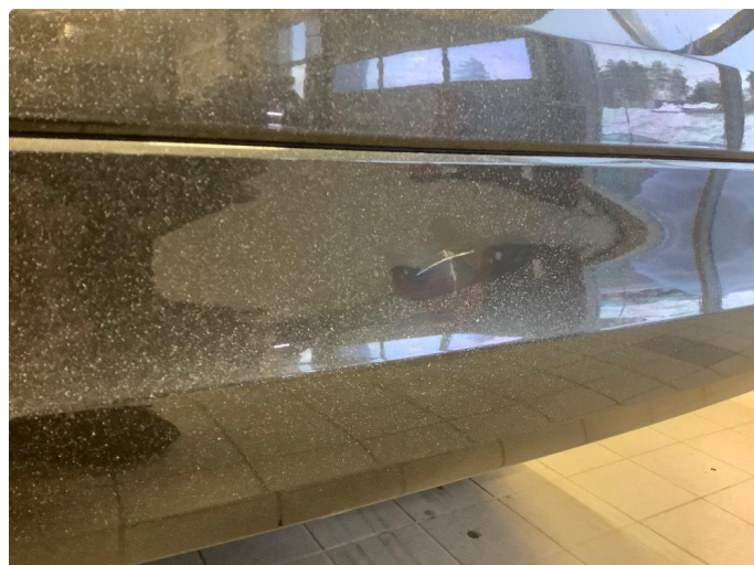
1.2 Lite merke på fanger bak