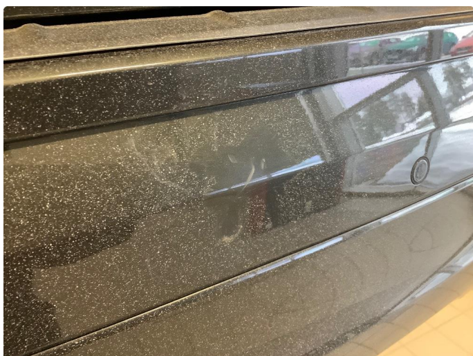
1.3 Bruksriper bak, normalt