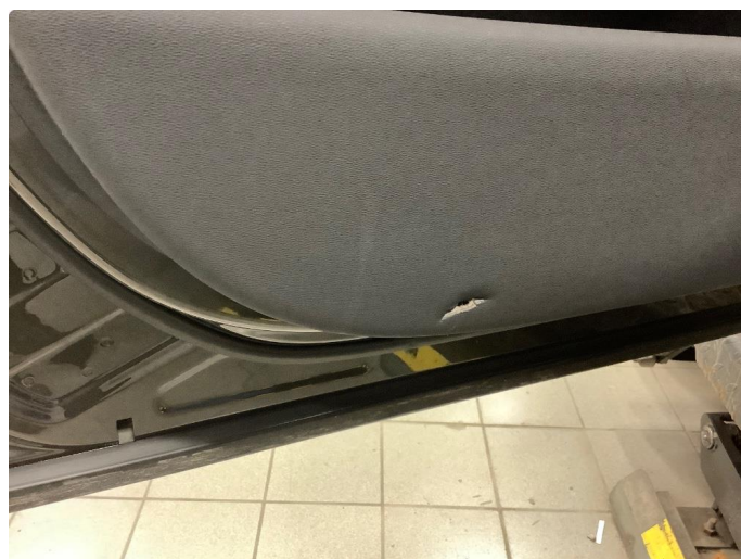
2.1 Hakk i dør trekk