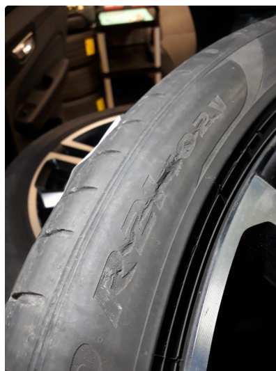
1.3 Dekkskade sommerhjul