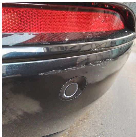
1.1 Riper i plastikken