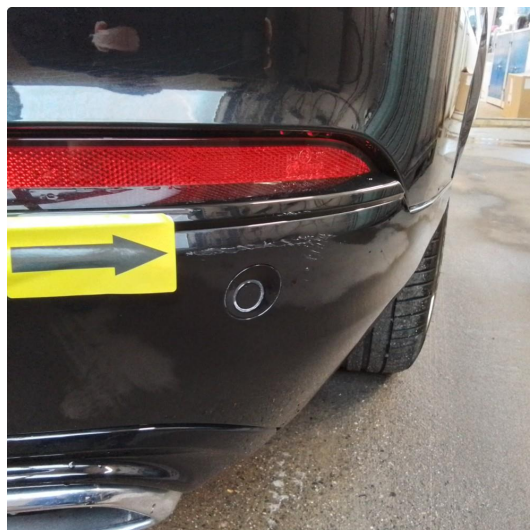
1.1 Riper i plastikken