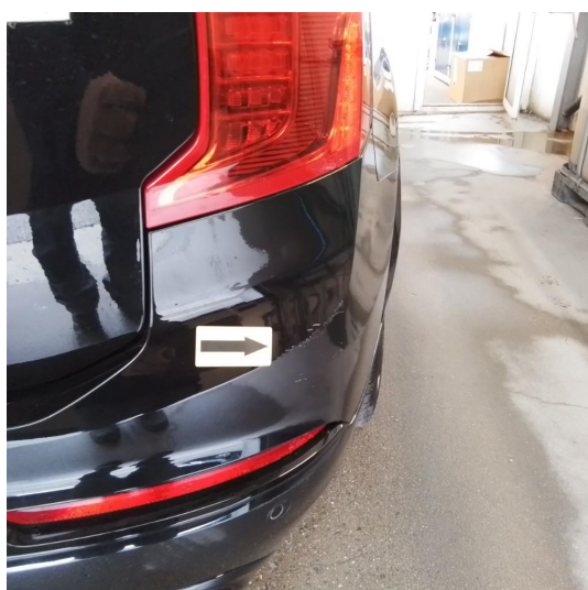
1.1 Riper i plastikken