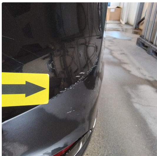
1.1 Riper i plastikken