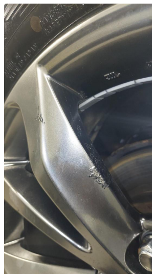
1.1 Betydelig oksidering