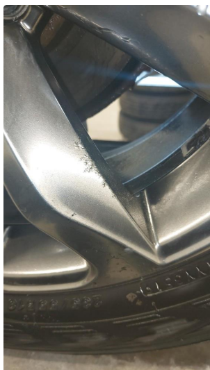
1.1 Betydelig oksidering