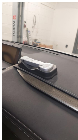
3.1 Øvrige feil