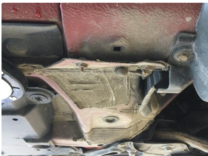
1.1 Noe bøyd i jekkfester