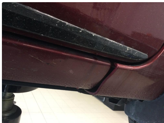
1.1 Noe bøyd i jekkfester