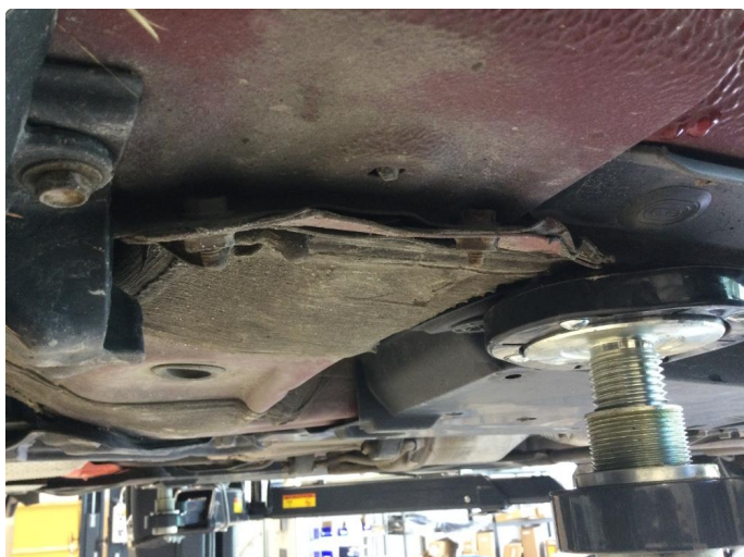
1.1 Noe bøyd i jekkfester