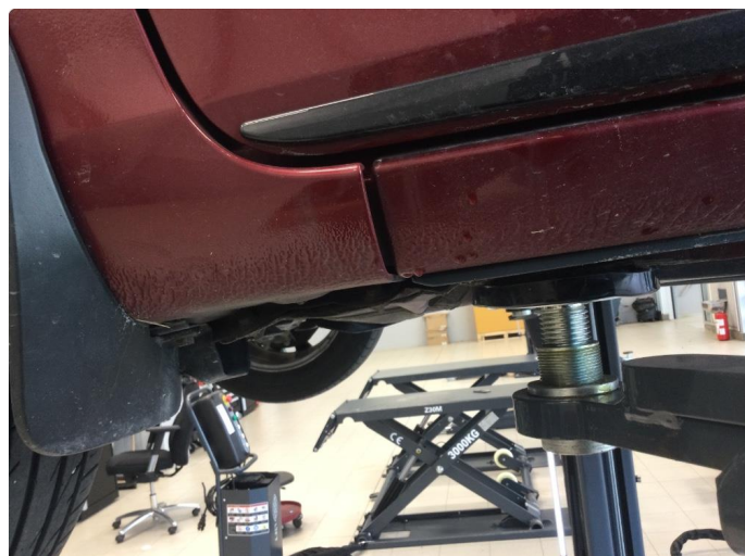
1.1 Noe bøyd i jekkfester