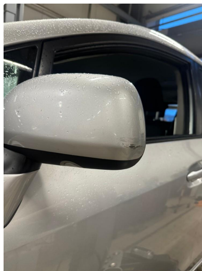
2.1 Speilhus riper